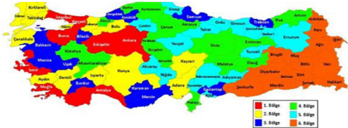
شکل (۱): نقشه منطقه ای استان در برنامه مشوق‌های سرمایه‌گذاری

در جدول زیر مشوق‌ها و نرخ‌های پشتیبانی مربوط به سرمایه‌گذاری‌های منطقه‌ای ارائه شده است.